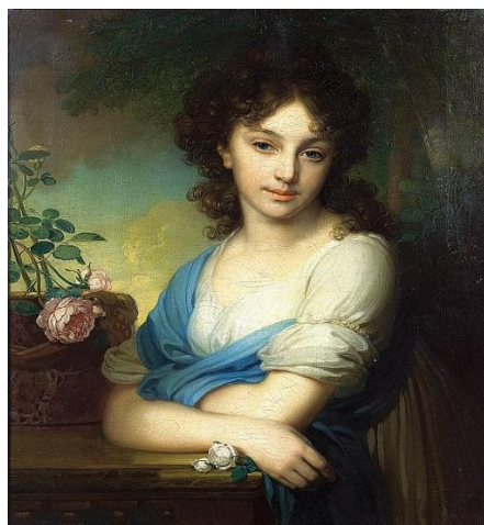
б) В. Боровиковский «Е.А.Нарышкина»