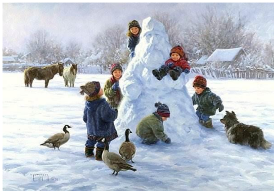
д) Р. Дункан «Зимние забавы»