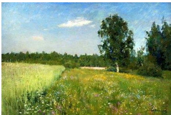
в) И.Левитан «Лето»