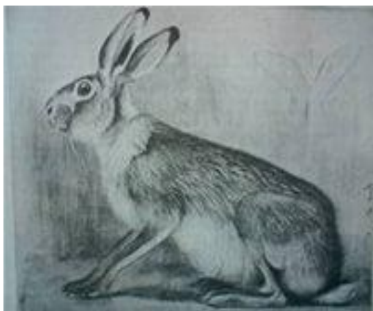
а) В.Ватагин «Заяц»