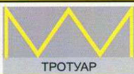
Разметка "Обозначение остановочных пунктов маршрутных транспортных средств и стоянок такси"