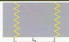
Разметка "Обозначение границ зоны остановочного пункта трамвая, расположенного на одном уровне с проезжей частью дороги"