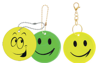
Брелоки и подвески